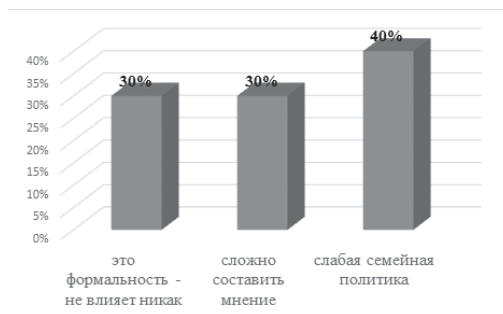
Рисунок 11 – влияние государственной семейной политики на образ семьи

30% респондентов полагают, что законы и семейная политика в нашей стране лишь формальность и все, что делается внутри семьи и для нее зависит только от самой семьи и государство даже с помощью инструментов поддержки таких, как семейная политика, не в состоянии должным образом оказать то или иное принципиальное воздействие на семью.