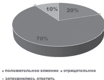
Рис. 12 – влияние СМИк на формирование образа семьи

Оценка влияния института СМИ на институт семьи сложилась следующим образом.